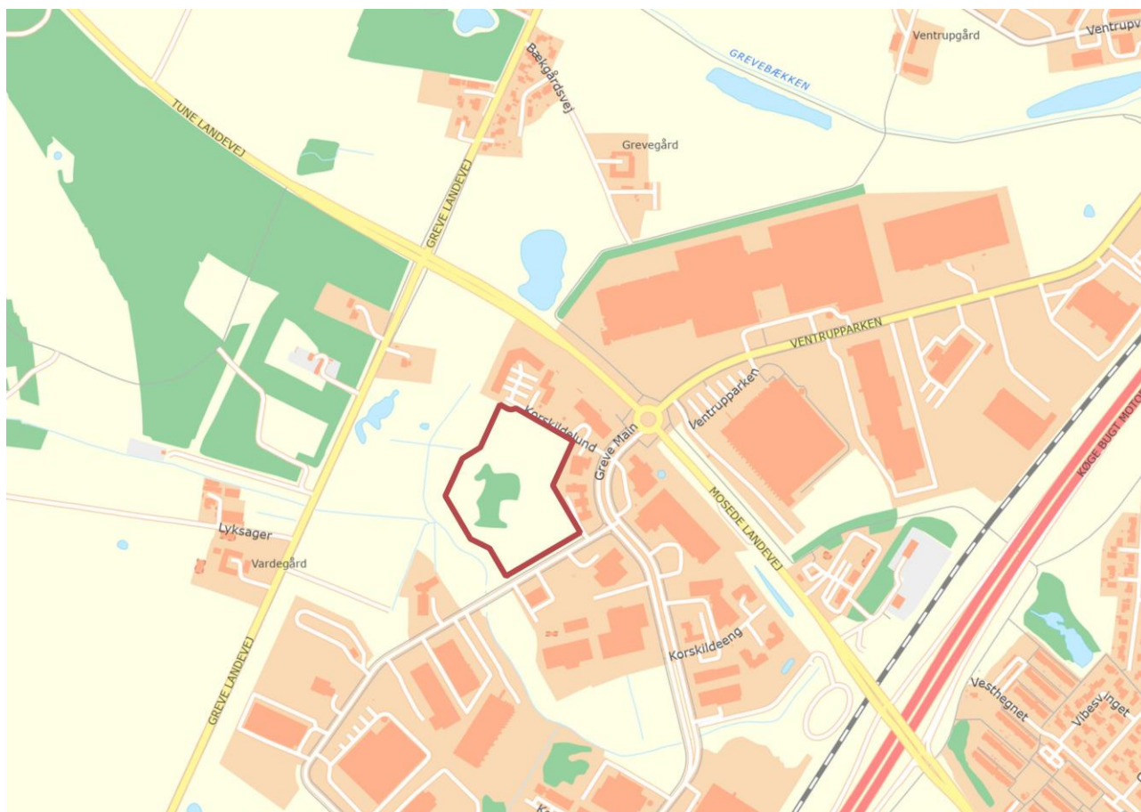
Fig. 1. Oversigtskort. Forundersøgelsesarealets placering er angivet med rødt. (Indeholder data fra Styrelsen for dataforsyning og Effektivisering, Skærmkort, september 2021).

Beretning for større arkæologisk forundersøgelse af 31.307 m 2 forud for byggemodning samt salg af arealet. Oprindeligt var 40.000 m 2 indstillet til forundersøgelse, men undervejs blev to mindre delarealer på i alt 8.693 m 2 trukket ud af forundersøgelsesarealet af bygherre, da disse ikke ville blive berørt af anlægsarbejdet. Projektet skiftede bygherre undervejs, således at det første budget blev indsendt til SLKS i 2017 – hvorefter projektet blev udskudt – i 2020 blev budgettet genindsendt til godkendelse i KUAS med Greve Kommune som ny bygherre. Forundersøgelsen blev udført af Museum Sydøstdanmark i januar-marts 2021 med et ophold undervejs.