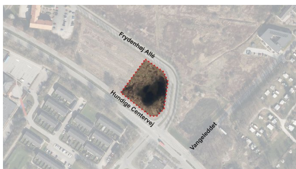
Figur 1_Område for Kommuneplantillæg nr. 8

Det nye areal til daginstitution udgør i dag en del af kommuneplanramme 1BE2. Det har anvendelsen 'Område for Blandet bolig og erhverv', og er beliggende i byzone. Området er omgivet af Hundige Centervej og Frydenhøj Allé og det kommende Fripleshjem. Arealet til daginstitution bliver en del af området Hundige Strandby.