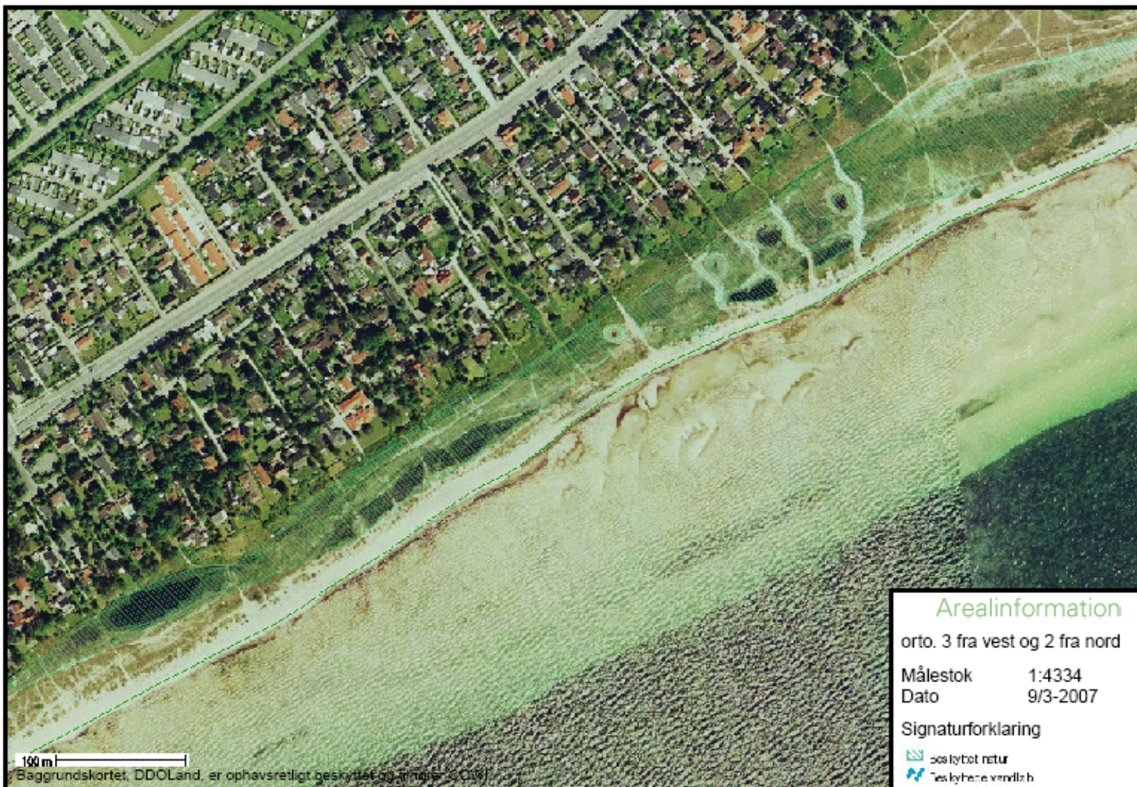
Stranden set på luftfoto