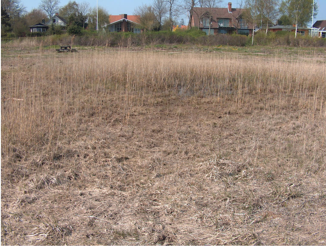
Eksempel på en lokalitet på stranden i begyndende tilgroning, hvor Grønbroget Tudse muligvis stadig kan yngle, da der stadig er lidt åbent vand mellem tagrørene