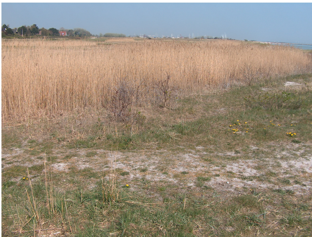
Eksempel på en tilgroet lokalitet fra stranden, hvor Grønbroget Tudse ikke kan yngle, da Tagrør skygger for meget på vandfladen

I april 2007 har NIRAS for Greve kommune registreret padder på Hundige Strand. I forbindelse med registrering af forekomsten af levestedernes tilstand er her udfærdiget en vejledning til, hvordan gunstig bevaringsstatus kan sikres.