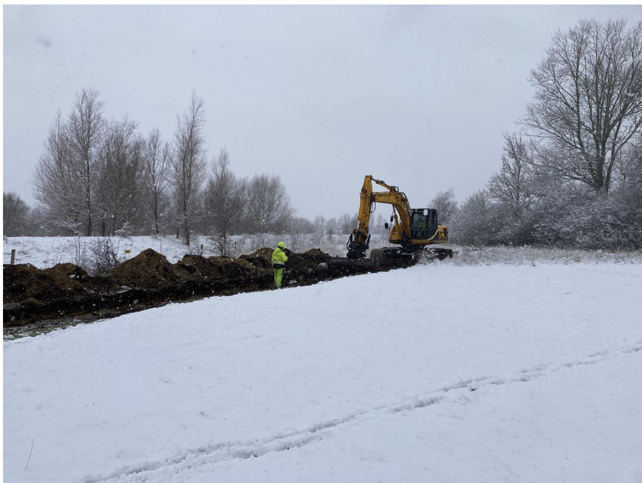
Fig. 2. Arbejdsfoto af grøft 1 åbnet i januar 2021.

Undersøgelsen konstaterede i alt 2 udaterede kogegruber muligvis fra oldtid, 2 udaterede stolpehuller formentlig fra oldtid, 1 nyere tids vejkasse, adskillige naturfænomener i form af rodvælttere, vådbundspletter, undergrundsvariationer og træstød, flere recente forstyrrelser bl.a. dræn, samt enkelte naturlige stenspor. Anlægsregistreringerne gav ikke anledning til yderligere arkæologisk undersøgelse.