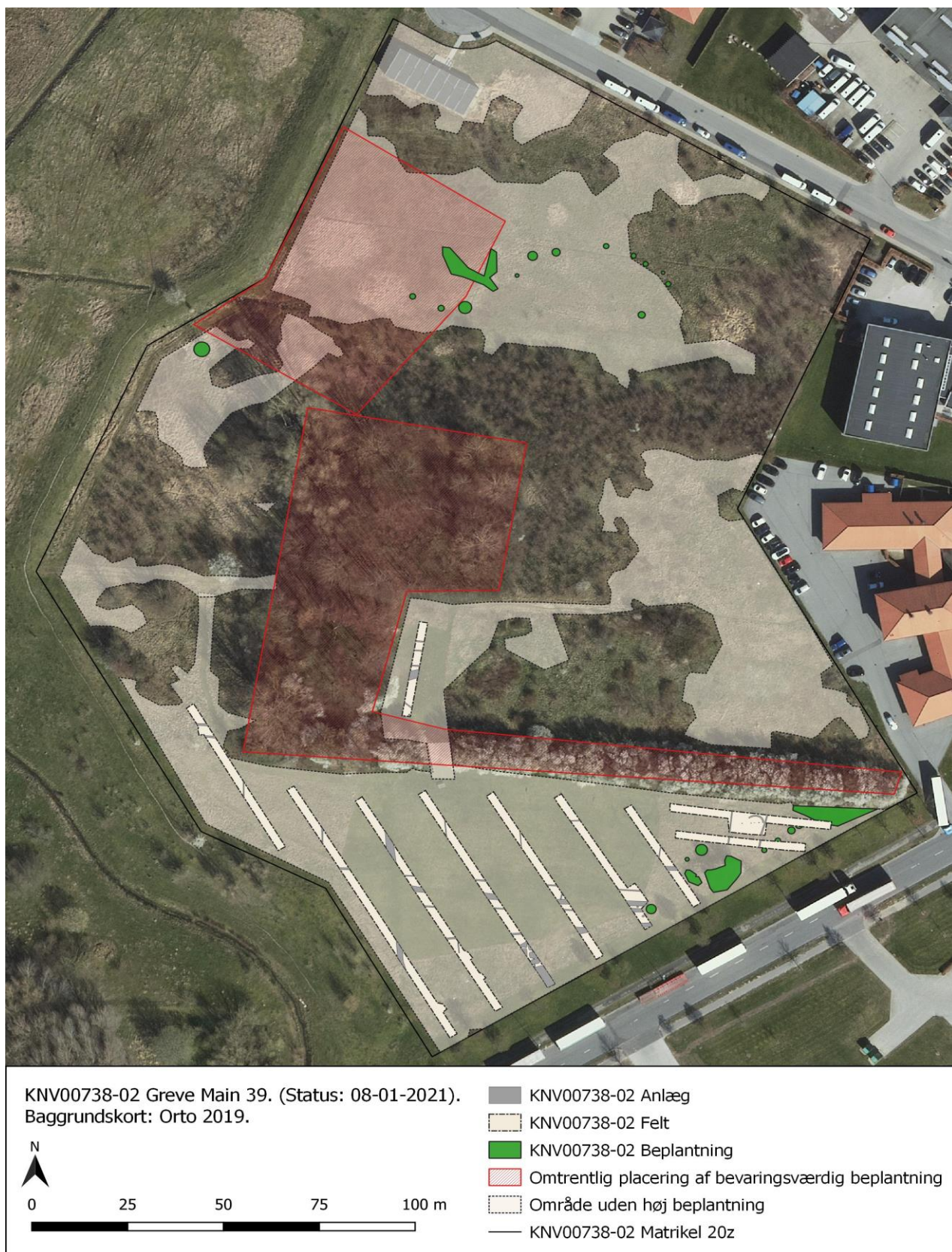
Fig. 3. Oversigtskort over undersøgelsesområdet samt delarealer der ikke blev en del af forundersøgelsen.