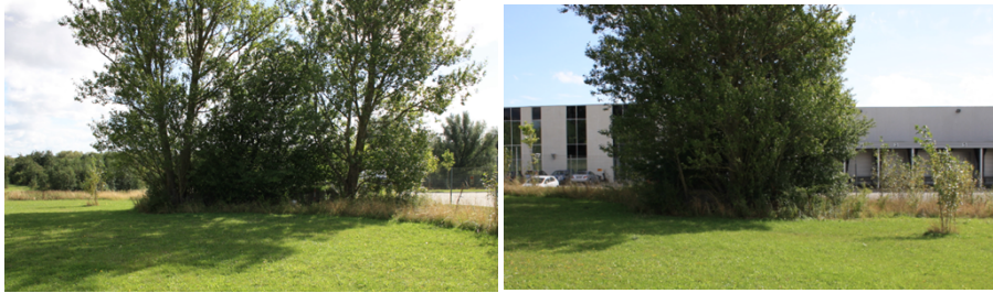
Figur 3. Billeder taget på museal besigtigelse i 2015. Man kan ikke se fortidsmindet grundet træer.

Forundersøgelsen på matrikel 20bi skal undersøge, om der er bevaret yderligere dele af fæstningsværket på denne matrikel og/eller eventuelt andre fortidsminder. Undersøgelsen bliver foretaget af Museum Sydøstdanmark.