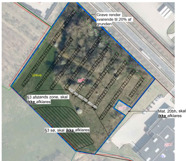
Figur 4. Oversigtskort fra ansøgningen. Projektområdet hvor de 9 søgerender placeret udgør et areal på 12.000 m 2 af matriklen. Arealet er på oversigtskortet afgrænset med en buet sort linje. Nord for