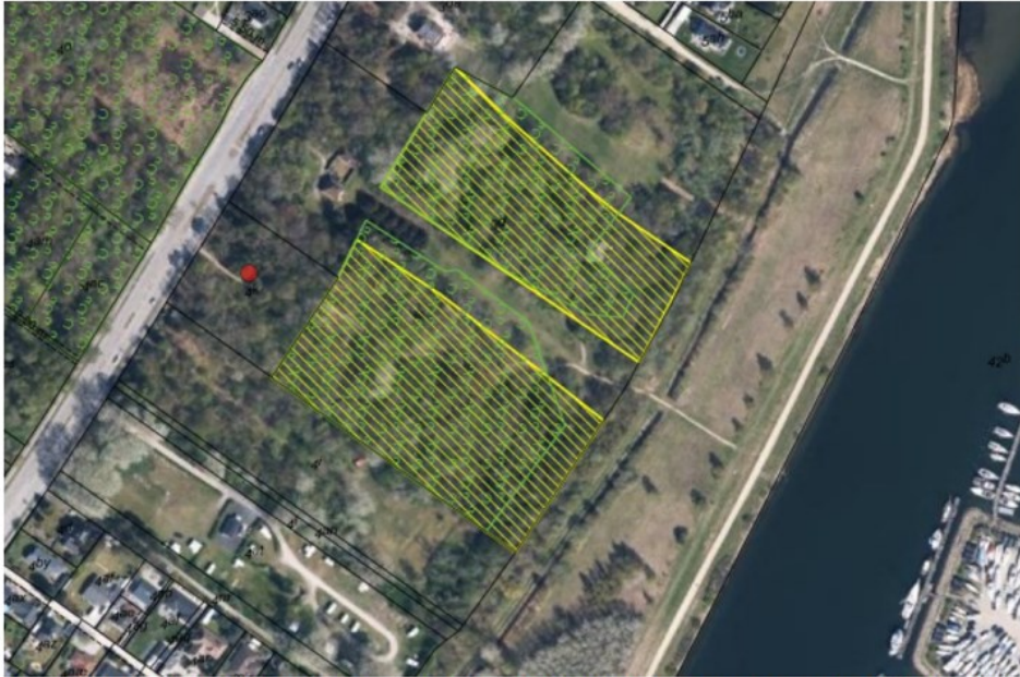
Figur 1. Fredskovsplikten tilrettes, således, at der fremover er fredskovspligt på det areal, der er markeret med gul skravering. Det eksisterende fredskovspligtige areal er markeret med grøn skovsignatur. Matrikelgrænser er markeret med sort streg.

Den nærmere forståelse af ovennævnte passus skal evt. afklares med Miljøstyrelsen. Det påhviler i den forbindelse køber at indhente myndighedsgodkendelse samt andre eventuelle tilladelser til den af køber påtænkte brug.