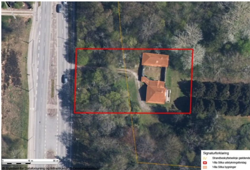
Figur 4, udstykningsforslag, fra ansøgningen.

Ved afgørelse af 22. april 2024 har Kystdirektoratet på den ene side givet afslag til ændret anvendelse af Villa Sitka til daginstitution og lignende formål, men har på den anden side givet dispensation efter naturbeskyttelseslovens § 65b, stk. 1, jf. § 15 til ændret anvendelse af Villa Sitka til foreningsaktiviteter samt dispensation til udstykning.