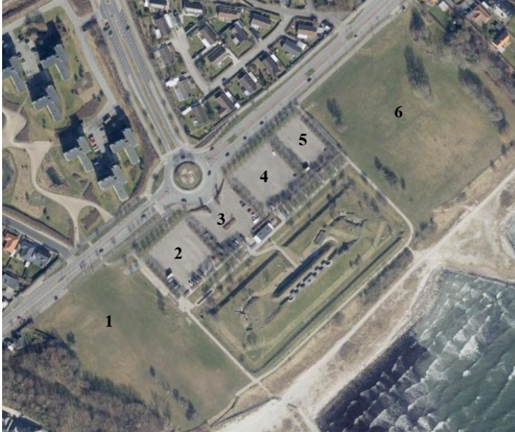
Billede 1: Kort over Mosedede fort med markering af områder: Område 6: Tivoli, Område 1, 2, 3, 4, 5: Parkering.

fæstnet med sten eller betonklodser. Der kommer ikke til at køre maskiner på arealet, der bliver kun brugt fodfolk og trillebøre.