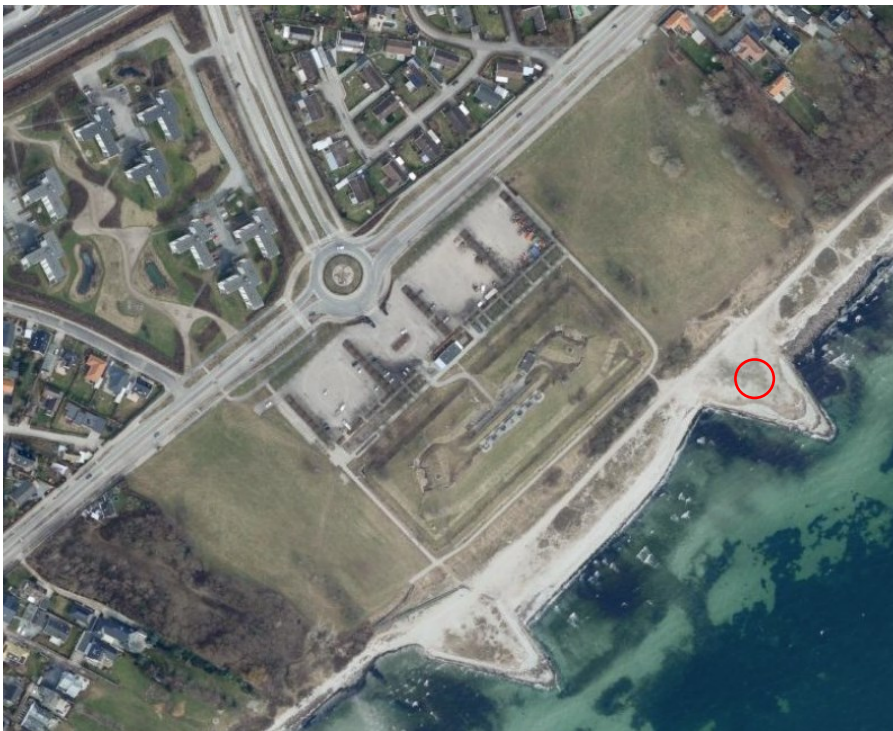
Billede 1: Rød cirkel markerer hvor bålet ca. kommer til at ligge.

Bålet vil blive opbygget den 22. juni og fjernet den 24. juni.