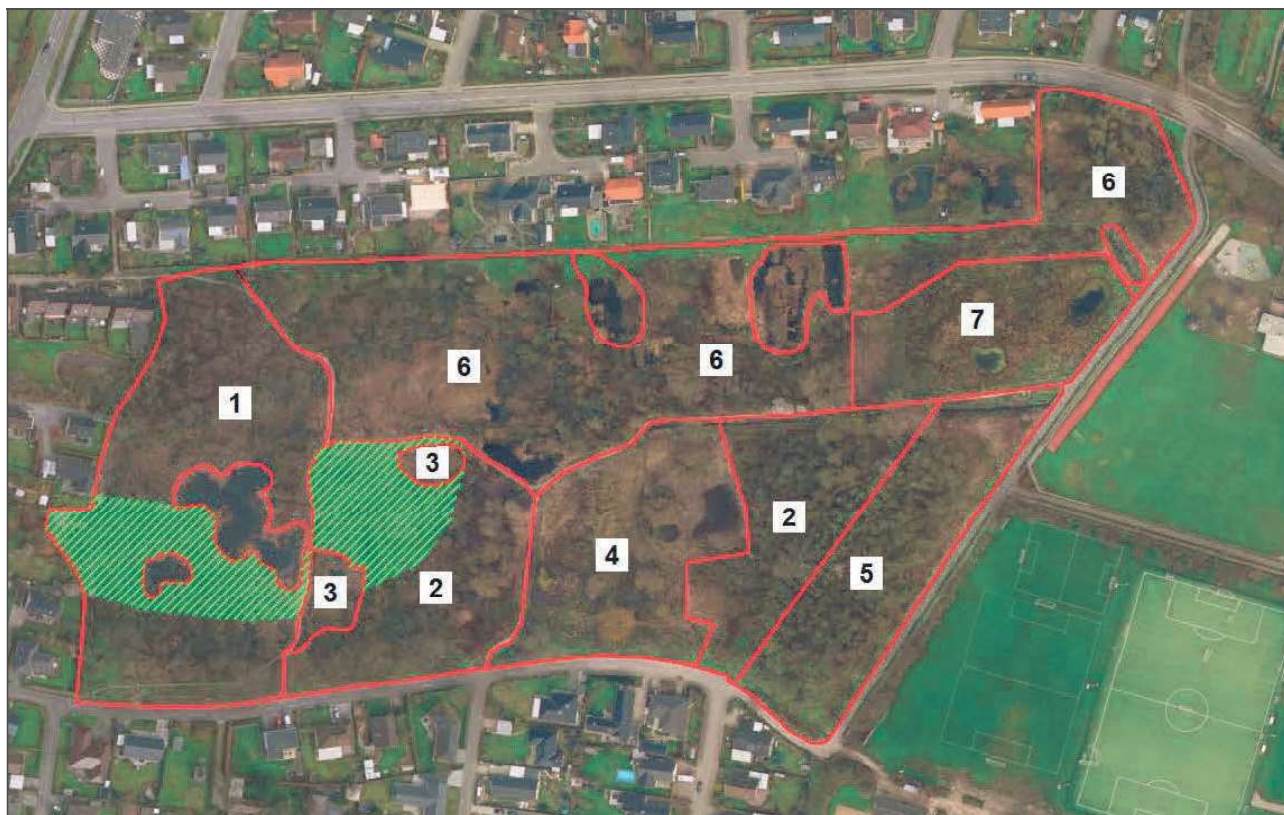
Figur 2: Delområder i Brødmosen. Grøn skravering angiver plejeområder i delområde 1 og 2.