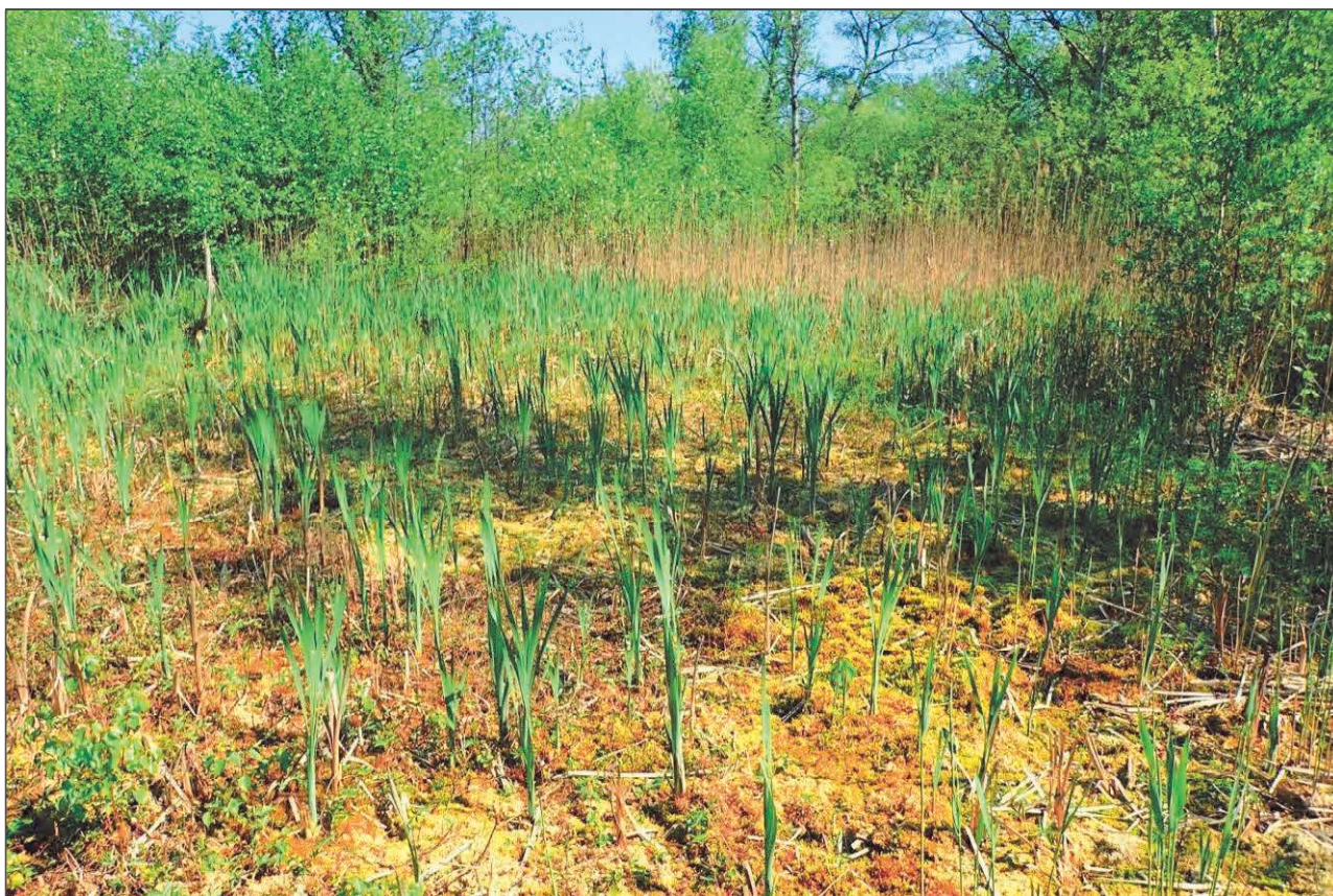
Foto 1. Delområde 3. Hængesæk i den sydvestlige del af Brødmosen.

Hængesækken mod nordøst er præget af ca. 1 - 5 m høje eksemplarer af Dun-Birk. Arealet fremtræder dog endnu ret lysåbent.