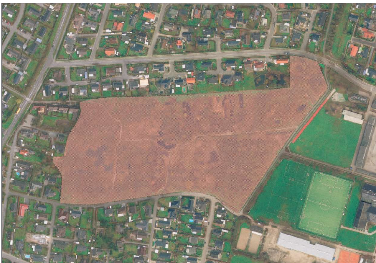
Figur1. Arealerne i Brødmosen omfattet af plejeplanen.

Nærværende plejeplan er udarbejdet for Greve Kommune på grundlag af en besigtigelse i maj 2018. Planen erstatter "Brødmosen - Forslag til Plejeplan, 2010". Den indeholder en kortfattet, generel beskrivelse af mosen, en særkilt omtale af naturforhold m.v. indenfor syv forskellige delområder samt en gennemgang af plejetiltag, som vurderes at kunne medvirke til, at områdets naturmæssige og rekreative værdier opretholdes eller forbedres. Brødmosen rummer meget væsentlige naturkvaliteter og fremtræder mindre kulturpåvirket end flertallet af grønne områder på egnen. Mosen er bl.a. i kraft heraf samtidig af betydelig rekreativ værdi.