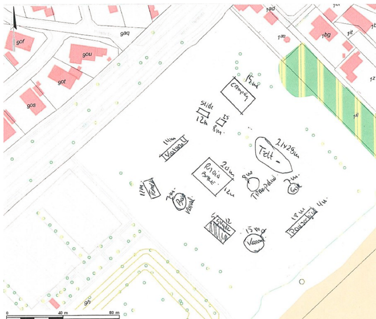
Billede 3: Tivoliland opstilling på den nordlige plæne.