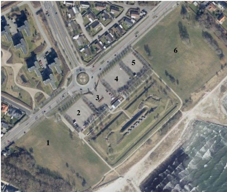
Billede 2: Kort over Mosede fort med markering af områder: Område 6: Tivoli, Område 1, 2, 3, 4, 5: Parkering.