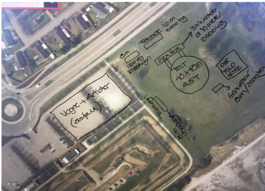
Oversigtsplan over den nordlige del af fortidsmindet med de ansøgte elementer markeret (fra ansøgningsmaterialet)

Billede 2: Kort over Mosede Fort med markering af aktiviteterne der skal foregå.