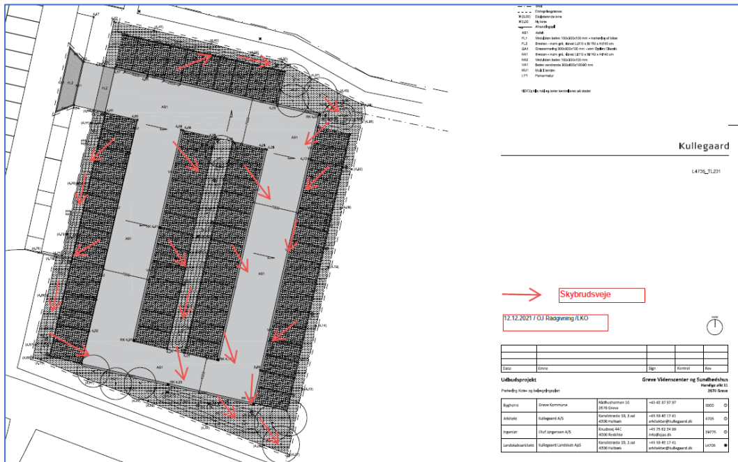
Figur 3: Skitse over skybrudsveje, der ved kraftige skybrud afvander i sydøstlige hjørne mod vejen