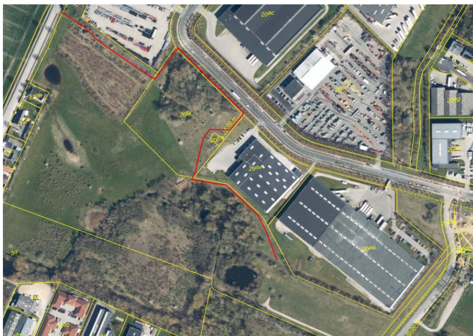
Figur 1. Kort over trampesti v. Karlslunde Landevej (rød linje viser trampestiens forløb).