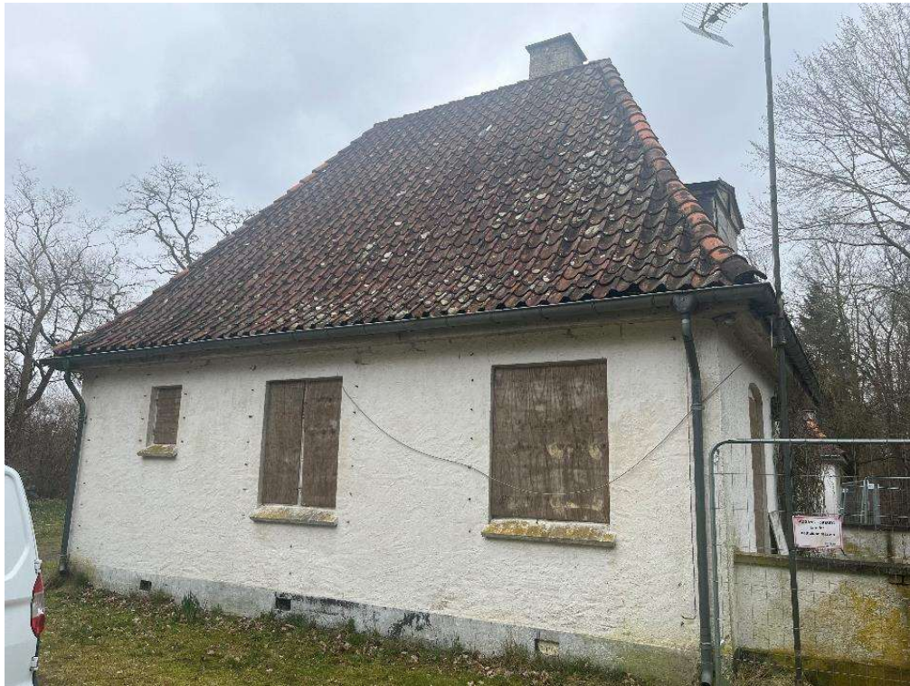
Billede 1. Hovedhuset