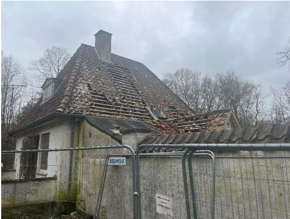
Billede 3. Hovedhusets tagbelægning er faldet ned i større områder.