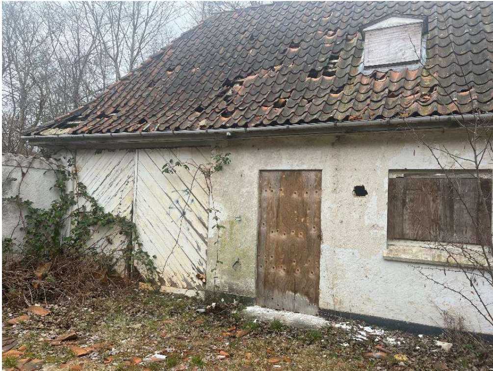
Billede 5. Anneksets tagbelægning er ligeså i meget dårlig stand.