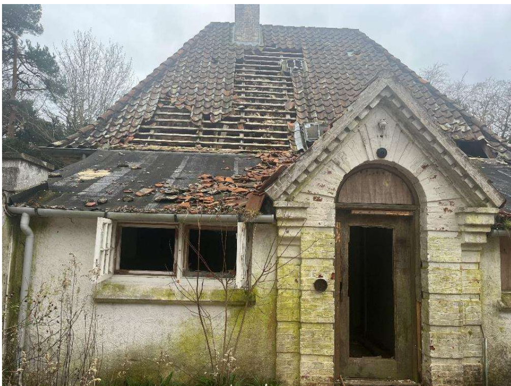
Billede 4. Hovedhusets tagbelægning fra anden side.