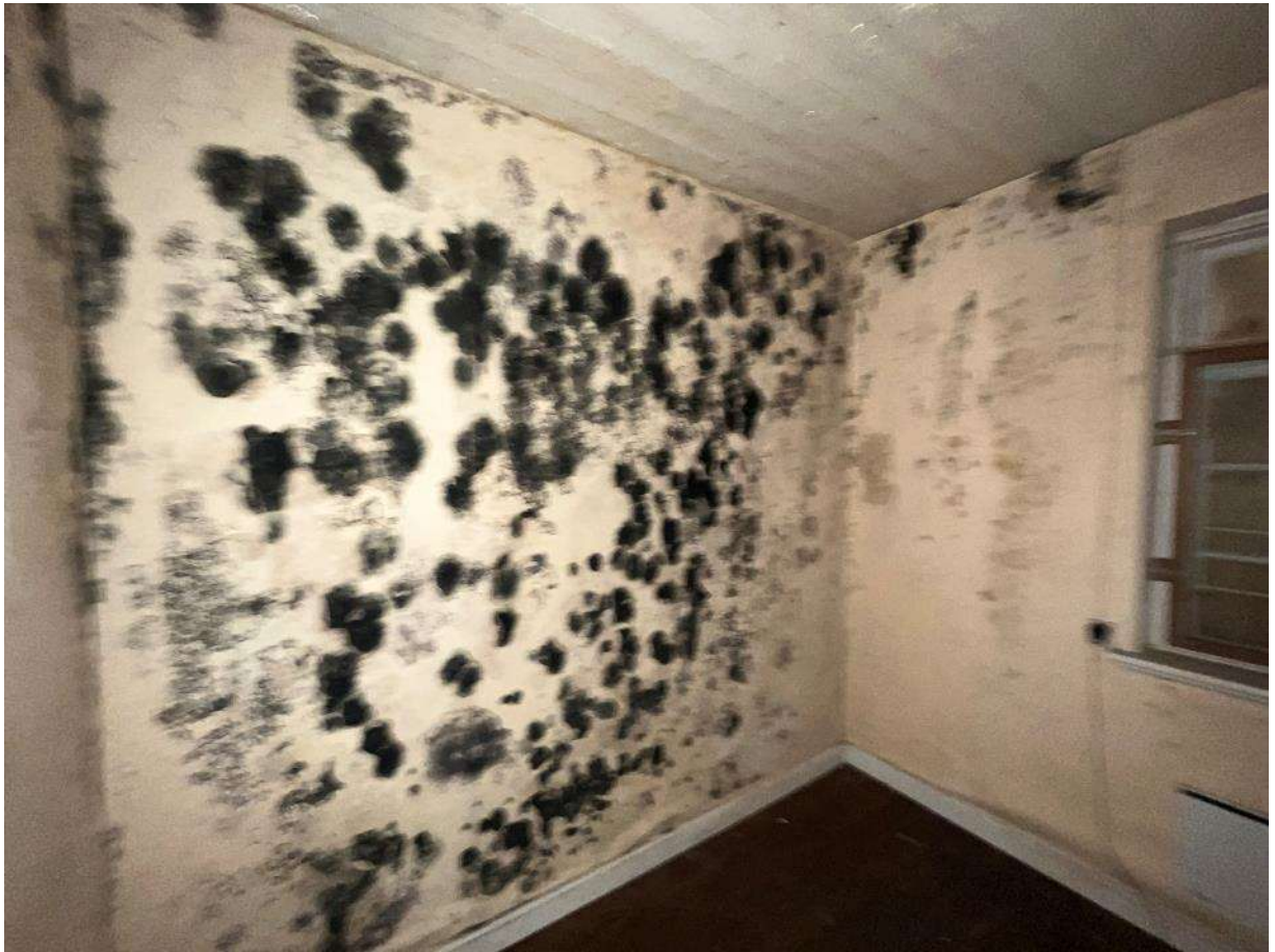
Billede 7. Bygningen er omfattende vandskadet indvendigt. Her med kraftig udblomstring af skimmelsvamp.