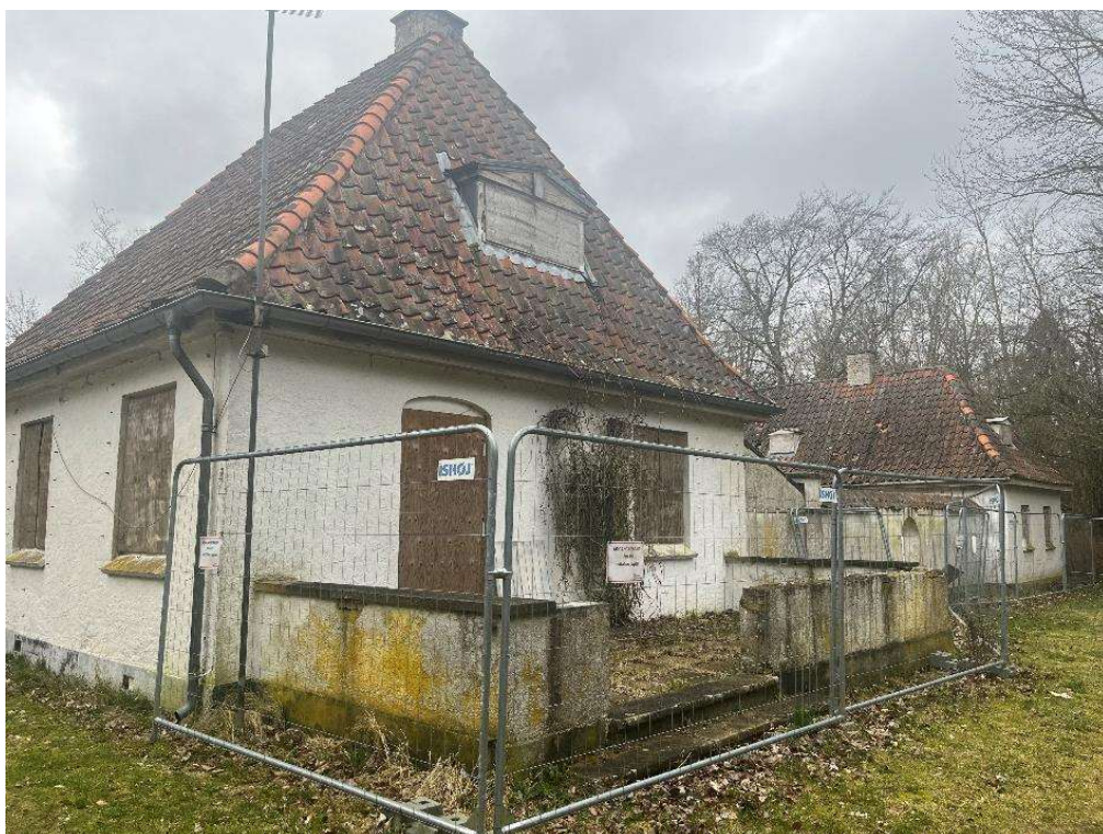
Billede 2. Hovedhuset set fra østsiden